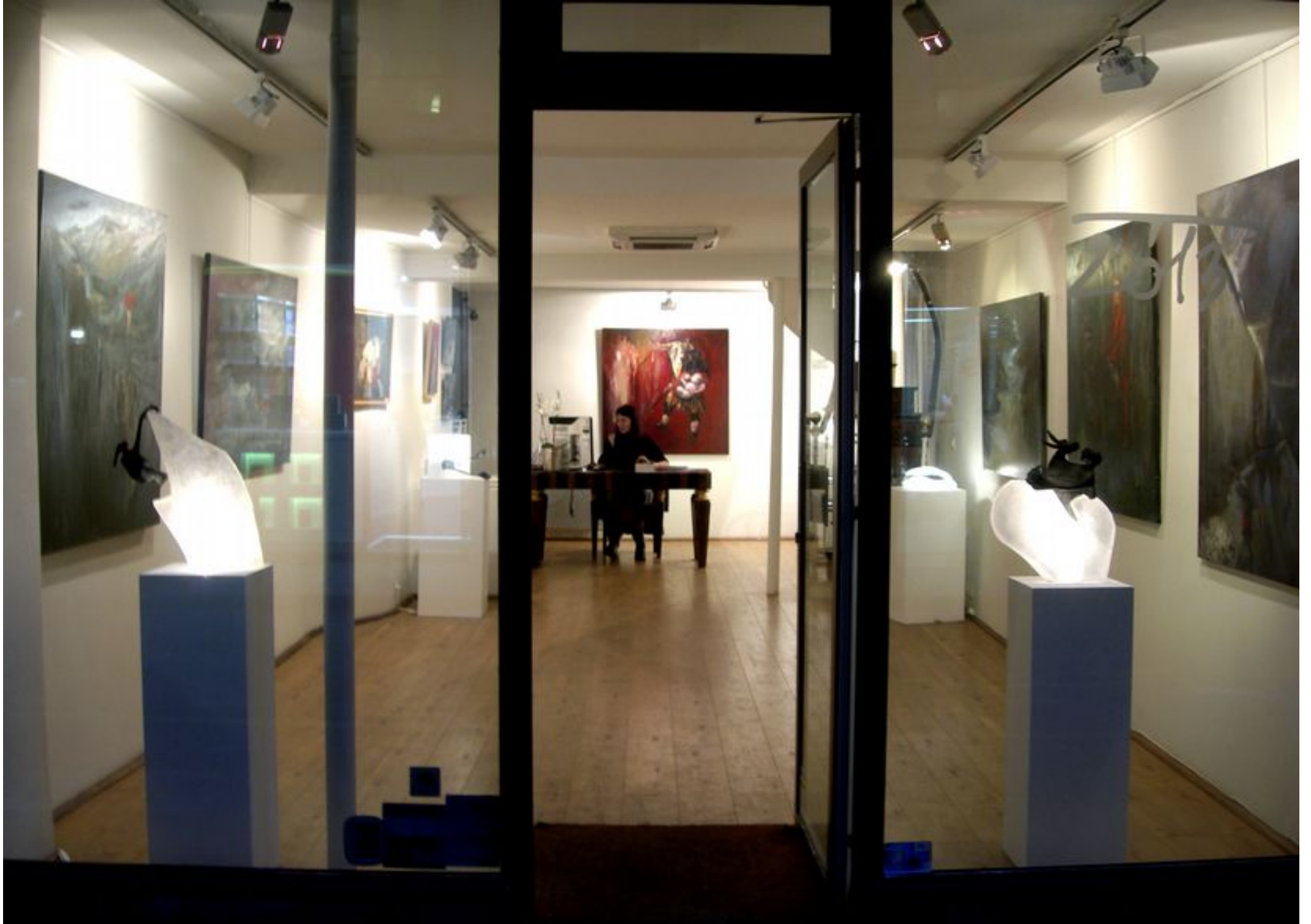
Galerie De Buci, Rue de Seine, Paris 6ème, novembre 2013.